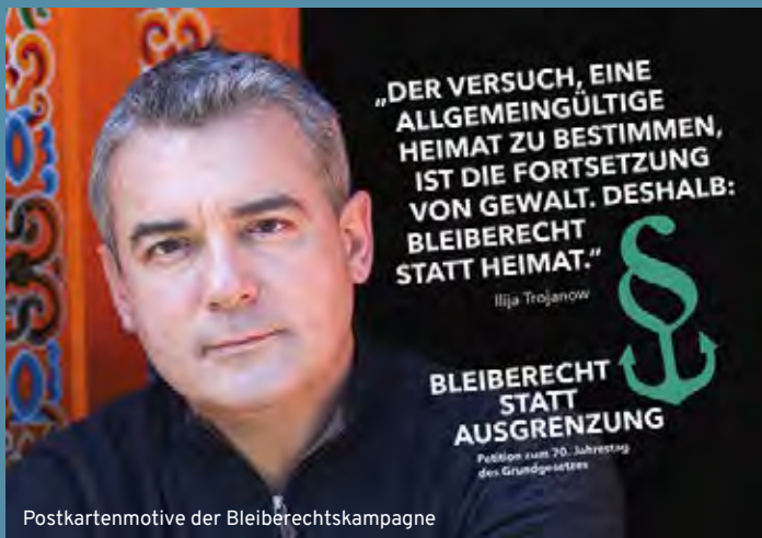
Postkartenmotive der Bleiberechtskampagne

Die Situation für Illegalisierte und Geduldete wird sich mit den drastischen Verschärfungen im neu beschlossenen „Geordnete-Rückkehr-Gesetz“ noch deutlich verschlechtern. Es beinhaltet unter anderem einen neu geschaffenen Status unterhalb der Duldung, Leistungskürzungen unter das Existenzminimum und die nahezu unbegrenzte Erweiterung von Gründen für Abschiebungshaft. Unserer Forderung nach einem Bleiberecht für Illegalisierte und Geduldete erhält damit eine zusätzliche Aktualität und bezieht zugleich klar Position gegen den hiesigen Abschiebungs-Diskurs.