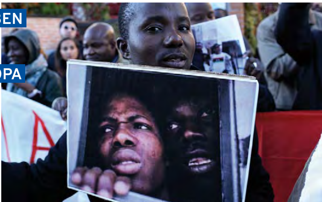
Ein Demonstrant weist auf die unmenschliche Situation in den Lagern Libyens hin.

Doch nur ein Bruchteil derjenigen, die aus den libyschen Gewaltverhältnissen fliehen, wird von der zivilen Seenotrettung aufgegriffen. Die weitaus meisten werden auf dem Weg nach oder in Libyen selbst festgehalten und dies mit aktiver Hilfe der EU: Mit Geldern für „Entwicklungshilfe“ werden afrikanische Anrainerstaaten Libyens erpresst, aktiv die EU-Grenzvorverlagerung vor Ort militärisch durchzusetzen. Auf liby-